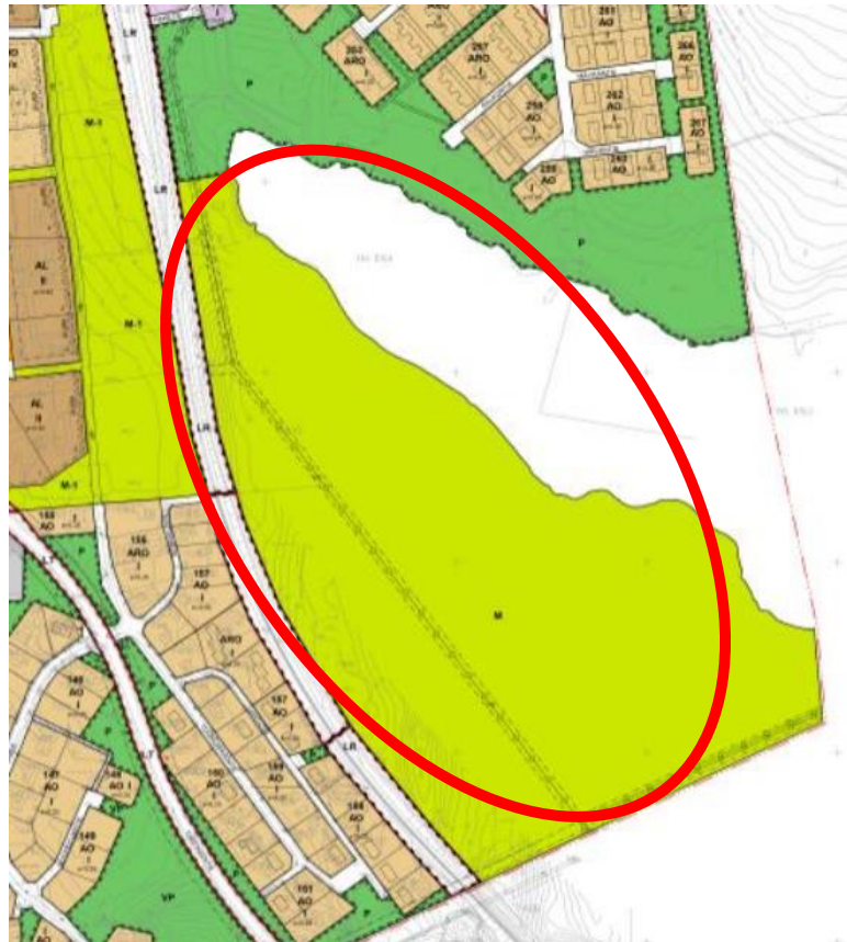
Ote alueen asemakaavasta, jossa kumottava alue on M-alue.

Alueella on voimassa Asemanseudun asemakaava (rakennuskaava) vuodelta 1977 ja se on vahvistettu 11.8.1977. Asemakaavassa nyt kumoamisen kohteena oleva alue on maa- ja metsätalousaluetta (M).